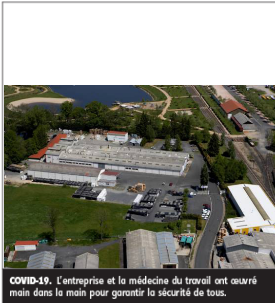
COVID-19. L'entreprise et la médecine du travail ont œuvré main dans la main pour garantir la sécurité de tous.

rières ont été imposés et les premières communications affichées dans les ateliers de production. « Nous n'avons jamais arrêté de produire, les salariés sont restés en poste sur la base du volontariat », indique le directeur. Les salariés des bureaux ont été placés en télétravail.